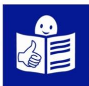
Logo du langage FALC